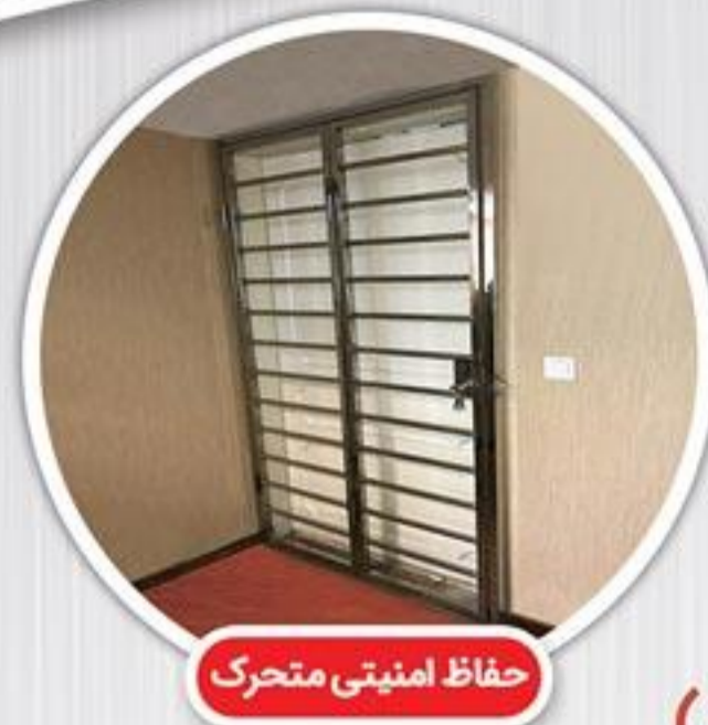
حفاظ امنیتی متحرک