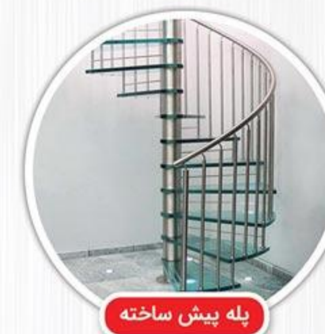
پله پیش ساخته

اصولا در هر مکانی و برای هر نوع کاربری پله مورد نیاز است. جدا از عملکرد کاربردی آن ، در بسیاری از مواقع پله ها نقش ثانویه زیبایی را هم ایفا می کنند. ساخت پله یا اضافه کردن آن به ساختمان ، دارای هزینه های بالا و زمان بر می باشد ، از این رو پله های پیش ساخته می توانند راه حل های مناسبی برای تمام نیازها ارائه دهند.