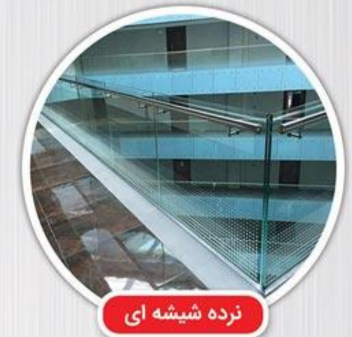
نرده شیشه ای

با اضافه کردن نرده به راه پله ، ایمنی راه پله تامین می شود. درکنار ایمنی بودن ، شما می توانید زیبایی خاصی را به راه پله های منزل یا محل کار خود بدهید. بدین منظور می توان از نرده های ترکیبی استیل و شیشه استفاده نمود. استفاده از ترکیب شیشه و استیل در کنار هم ، علاوه بر بخشیدن جلوه ی بسیار شکیل و مدرن به ساختمان و محل سکونت ، باعث افزایش طول عمر و کیفیت و کارایی محصول نیز میگردد.