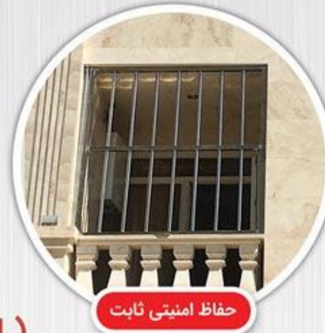
حفاظ امنیتی ثابت

حفاظ های امنیتی ، نسل جدید سیستم های ایمنی حفاظت از ساختمان می باشند که علاوه بر زیبایی از استحکام بسیار بالایی نیز برخوردار هستند. روش ها و مزایای متعددی در نصب حفاظ های امنیتی (بانکی) وجود دارد ، اما در این بین نکات حائز اهمیت از جمله اتصال لوله و میلگرد آهنی به پروفیل ، قابلیت متحرک بودن و امکان اضافه کردن قفل برای امنیت بیشتر وجود دارد. استفاده از جوش آرگون و پیچ های مخصوص بیشترین کاربرد را در این روش داراست.